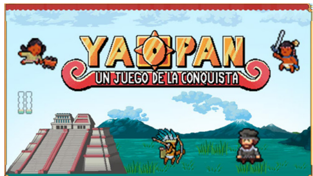
Figura 10 / Yaopan. Una historia de la Conquista

Desarrollado íntegramente por la Universidad Nacional Autónoma de México, esta entrega nos posiciona en la perspectiva de los tlaxcaltecas, pueblo que se unió a los recién llegados españoles en el Siglo XVI para derrotar a los aztecas, contra quienes estaban en guerra previamente. Por primera vez los pueblos originarios aparecen como conquistadores y no sólo como conquistados, ya que efectivamente los tlaxcaltecas fueron vencedores en 1521 tomando Tenochtitlán. Esta versión de la historia está basada en un lienzo confeccionado en 1552 que mediante 87 dibujos plasma las batallas libradas desde la perspectiva tlaxcalteca y que tuvo como finalidad dar cuenta a la corona española de su colaboración en la conquista, para asegurarles así ciertos privilegios. Todos los debates que esta premisa plantea son desde luego interesantísimos y lamentablemente exceden la intención de este trabajo, pero no queremos dejar de destacar la sorprendente postura que toma este juego, muy lejana a la cómoda imagen estereotipada de Latinoamérica que nombrábamos más arriba.