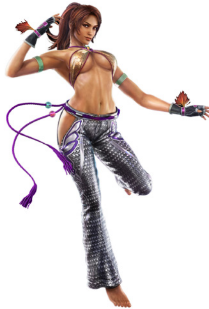
Figura 12 / Christie Monteiro de Tekken

Este interesante videojuego está protagonizado por Dandara, una mujer que podemos identificar como brasilera únicamente por su color de piel y su peinado, pero que no presenta “la sensualidad, las plumas, la vestimenta y adornos brillosos y coloridos” (Kerzman, 2019, pág. 8) u otros atributos exagerados como sí lo hacen los personajes brasileiros más conocidos: Blanka de Street Fighter II , Christie Monteiro de Tekken , Lucio de Overwatch o Laura Matsuda de Street Fighter 5 -todos videojuegos de combate, en los cuales lo único que importa del personaje es su particularidad a la hora de atacar, dicho sea de paso-