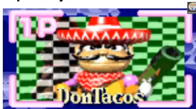
Figura 4 / Meme de Don Tacos

Tomemos el caso distintivo de Far Cry 6 (Ubisoft, 2021) un videojuego que en principio intenta hacer eco de problemáticas compartidas por muchos países latinos, tales como los gobiernos autoritarios, la miseria, los militares disparando contra su pueblo, la tiranía. Sin embargo los problemas saltan a la vista: por empezar, el juego está ambientado en la isla ficticia de “Yara” que claramente hace alusión a Cuba, por el dialecto de la