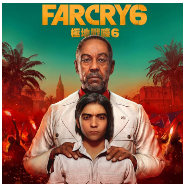
Figura 5 / Far Cry 6

población, la revolución guerrillera del '67 (en lugar del '57) y demás referencias. Evidentemente el caso cubano es complejo y aquí no vamos a desarrollarlo, simplemente no podemos ignorar el claro sesgo imperialista que el juego presenta: la opinión que el Primer Mundo tiene sobre los dirigentes que no se alinean a sus intereses no es ningún secreto. Pero dejando la política de lado, si bien en Far Cry 6 el pueblo latino aparece como fuerte y capaz de revelarse, el juego termina cayendo mínimamente en dos trampas ideológicas: por un lado toda la ambientación latina no pasa de ser una fachada, ya que en el fondo esta entrega de Far Cry es muy similar a las anteriores que transcurren en Tailandia, Nepal o África Central: al final todos los países del Tercer Mundo son más o menos iguales y se manejan de la misma forma; todo es una excusa para que el blanco occidental juegue a las aventuras y asesine de forma supuestamente justificada.