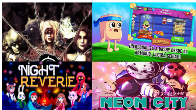
Figura 7 / Videojuegos del auto-borramiento

Más allá de lo expresado, este trabajo no quiere ser únicamente un punteo de los problemas en las representaciones latinas de los videojuegos que nos llegan de la cultura occidental dominante. Resulta muy interesante pensar qué sucede con los videojuegos producidos aquí, en Latinoamérica, porque en principio, una solución rápida al problema sería dar vuelta el asunto: si los juegos hechos por el “centro” para la “periferia” contienen imágenes estereotípicas de esta última, pues entonces habría que dejar a la periferia que hable por sí misma, como argumentarían con justicia los estudios decoloniales. Ahora bien, cuando volteamos a ver los videojuegos producidos por personas o empresas latinas nos encontramos con otra complicación: o bien estos juegos reproducen el estereotipo positivo, exótico y fácilmente exportable de una Latinoamérica pre-moderna, bucólica e inocente donde reina la naturaleza y la magia de los pueblos originarios ( Mulaka o Guacamelee! de México, Tunche de Perú) 2 ; o bien, y estos son los más, no tienen ningún rasgo latino distintivo y más allá de lo valorables que sean podrían haber sido hechos en cualquier parte, ya que recaen en una “normalidad” que evidentemente responde al sesgo occidental y no se preocupan por representar a los pueblos latinos ( Neon City Raiders de México, What the Duck de Brasil, Dashmellow de Colombia, Madison de Argentina, Omen of Sorrow de Chile, Night Reverie de Perú).