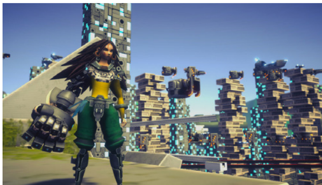
Figura 9 / Aztech Forgotten Gods

Este videojuego desarrollado por Lienzo, estudio mexicano responsable también de los títulos Mulaka y Hunter's , se pregunta cómo hubiera sido la civilización azteca de no haber sido conquistada por los españoles. Aquí asistimos a una futurista ciudad azteca, en la cual se mezclan aspectos de la contemporaneidad occidental con típicos elementos sci-fi pero teñidos de una estética que responde a la arquitectura y al arte que nos ha llegado de la antigua civilización. Si bien la jugabilidad y los demás aspectos formales del juego no presentan demasiadas diferencias con otros videojuegos del tipo acción-aventura en tercera persona, y también es verdad que los desarrolladores no inventaron un mundo alternativo sino que, nuevamente, usaron elementos tradicionales de la ciencia ficción pero pasados por el filtro precolombino -nuevamente aquí la pan-latinidad-, no se debería menospreciar el interesante planteo histórico deconstructivo que se corre del evolucionismo, y que podría leerse como una atractiva combinación entre las teorías del multiverso y Walter Benjamin, escenificando literalmente la Historia de los Vencidos.