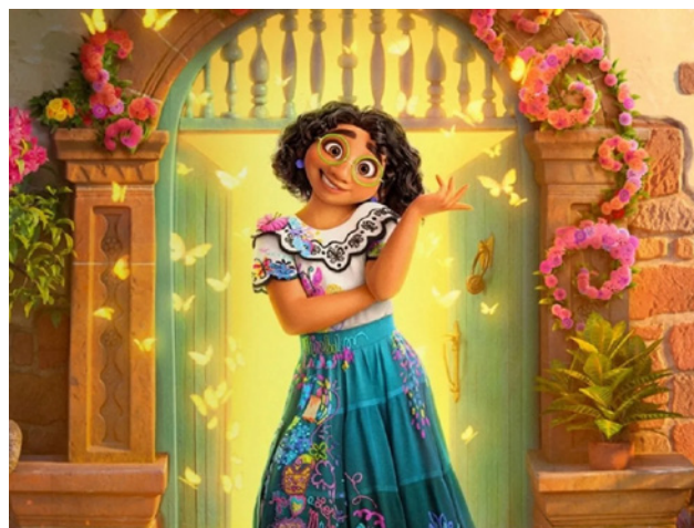
Figura 3 / Encanto (Disney, 2011)

to (2021), Río (2011)-. Este procedimiento se enmarca dentro de los “nuevos racismos”, más precisamente en el “daltonismo racista” tal como lo define Eduardo Bonilla-Silva: se niegan las razas y las etnias, como si eso otorgara igualdad de derechos a las personas no-blancas -y como si fuera algo deseable el erradicar la historia de las etnias en las cuales precisamente la raza blanca aparece como opresora-. Este gesto de aparente emancipación perpetúa el señalamiento de los latinos como algo “otro”, simplificando enormemente las costumbres y mezclando culturas que poco tienen que ver unas con las otras, con el agregado de intentar borrar la diferencia en favor de una supuesta igualdad que tampoco es cierta, ya que la opresión y las problemáticas sudamericanas no desaparecen por dejar de mostrarlas, y las desigualdades para con el Primer Mundo no son una cuestión de indumentaria o culinaria: la particularidad del racismo daltonico reside en que la ideología que lo sostiene niega las desigualdades raciales presentes en la sociedad, permitiendo a la población blanca mantener su posición de privilegio sin parecer racista (Bonilla-Silva, Lewis y Embrick, 2004).