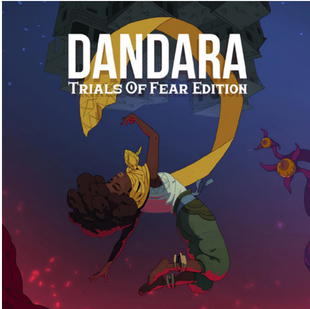
Figura 11 / Dandara: Trials of Fear

trepa al techo y paredes para explorar el escenario de una forma más flexible: incluso tenemos la posibilidad de alterar la gravedad y que el mundo gire cual cubo ru-bik para ver las cosas desde perspectivas distintas.