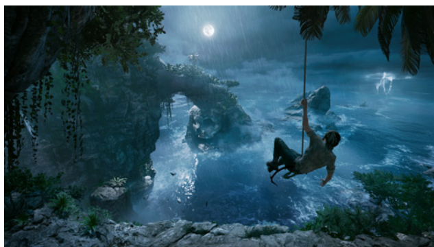
Figura 2 / Shadow of the Tomb Raider

Lo mismo con el territorio latinoamericano, víctima de “un Primer Mundo impuro que sueña con una otredad salvaje” (Richard, 2007, pág. 83): hogar de dictadores ( Trópico ), de peligrosos confrontamientos ( Call Of Duty: Ghosts ), narcos y carteles ( Narcos: Rise of the Cartels ), y tierras vírgenes llenas de magia aborígen ( Shadow of the Tomb Raider , Uncharted 3 ): “el paraíso perdido a cuya desnudez e inocencia debe volver el Primer Mundo para redimirse del pecado consumista” (Richard, 1994, pág. 1014). La selva latina es casi una metáfora de sí misma: todo lo peligroso, salvaje, el “sálvese quien pueda” o la ley del más fuerte, que responde al imaginario selvático tradicional, es tomado sin tapujos bajo la figura de la selva para indicar precisamente eso.