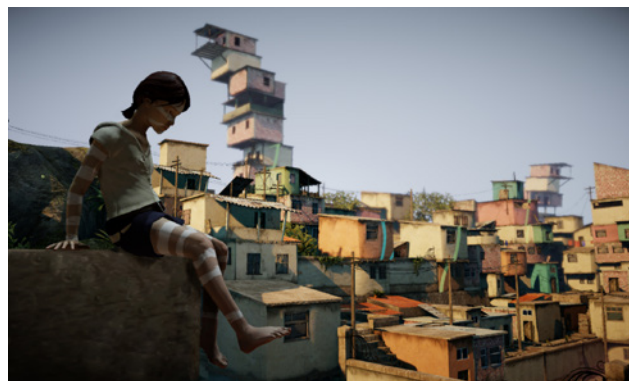
Figura 8 / Papo & Yo

nes me ayudaron a sobrevivir al monstruo que había en mi padre”. Semejante apertura no sólo condiciona la manera en la cual podemos leer esta obra, sino que nos dice algo sobre cómo el propio juego se posiciona, señalándose a sí mismo como un juego autoreferencial al que le interesa reescribir su propia historia, o mejor dicho, que le dará al jugador la oportunidad de hacerlo. Tras la dedicatoria tomamos el control de Quico, un niño que habita una favela de Brasil y que encontrará en su imaginación surrealista una forma de combatir su problemático entorno.