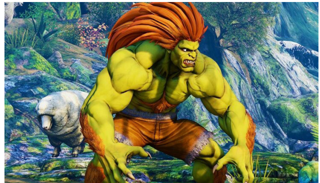
Figura 1 / Blanka de Street Fighter

De nuevo, resulta evidente que la mayoría de los personajes latinos o hispanos en videojuegos responden más a la forma en la cual "Occidente" nos ve – Occidente entendido como cultura dominante-, que como somos en verdad: desde luego que la representación de la realidad no es la realidad y siempre habrá desajustes para con esta; el problema se da si esos "desajustes" siempre apuntan al mismo lugar. Algo similar denunciaba Edward Said en su célebre trabajo sobre el orientalismo : el discurso que Occidente elabora sobre Oriente (llamado orientalismo), es una cuestión que depende mucho más de Occidente -el que lo produce- que de Oriente -el supuesto objeto del discurso- (Said, 2008, pág. 46).