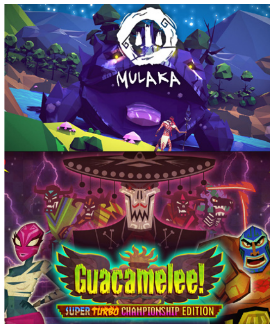
Figura 6 / Mulaka & Guacamelee!