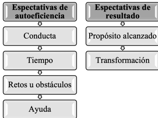
Figura 3. Análisis de las expectativas de los personajes