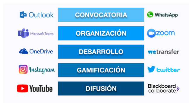
Gráfico 1. Herramientas digitales incluidas en el proyecto de innovación docente

Cada fase requirió el uso de diferentes herramientas.