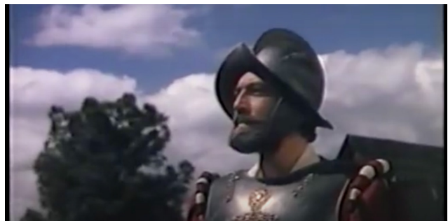
La figura de un conquistador. Film Capitán de Castilla (1947).

Nuestro propósito es aproximarnos a una cuestión no exenta de dificultades. Los problemas para detectar la auténtica personalidad del ser humano son evidentes desde las distintas interpretaciones que pueden hacerse no tanto de los observadores como, incluso, del sujeto mismo. Para solventar en la medida de lo posible esta cuestión, hemos tenido en cuenta, en primer lugar, los testimonios más cercanos a la descripción de la personalidad de Cortés como los aportados por Bernal Díaz del Castillo, López de Gómara y el propio Cortés; y otros autores que le trataron como el P. Juan Díaz o Andrés de Tapia. Cercano a los hechos figura Cervantes de Salazar y ya, desde una perspectiva histórica, Clavijero. En suma, las fuentes textuales básicas para ofrecer el enunciado de rasgos de carácter de Cortés han sido sus Cartas de Relación, las obras de Bernal Díaz del Castillo, Francisco López de Gómara, Francisco Cervantes de Salazar, el jesuita Francisco Javier Clavijero el clérigo Juan Díaz, Andrés de Tapia, Landa, Lorenzana, Motolínia, Solís, Bartolomé de las Casas, Orozco y Berra. De la consulta a dichas fuentes podemos enunciar los siguientes rasgos caracterológicos: