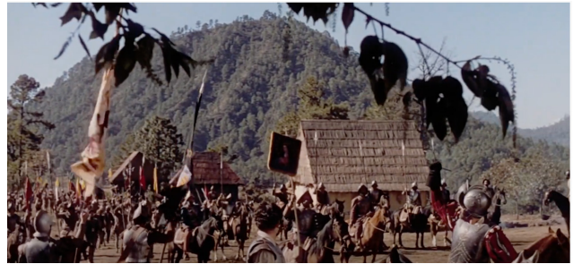
El film Capitán de Castilla (1947). Disponible en https://www.youtube.com/watch?v=QZLMPZbj8So&feature=emb_rel_pause

imprescindible, los testimonios de la iconografía y de los documentos audiovisuales, filmes y videos.