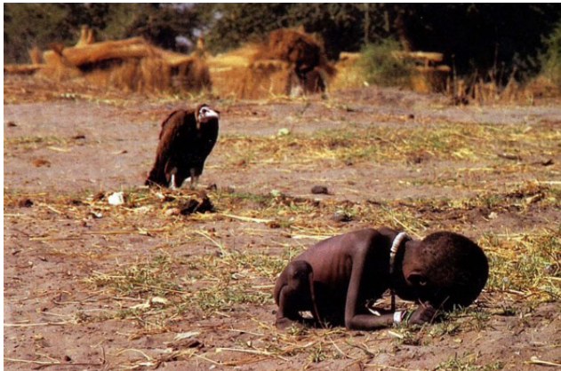
Fig. 1 Kevin Carter, "Struggling girl." (Sudán, 1993)