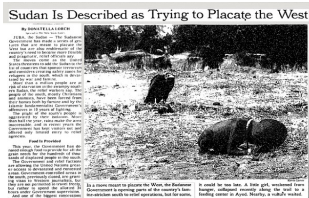
Fig. 2 Artículo publicado en el New York Times por Donatella Lorch, ilustrado con la fotografía de Kevin Carter.

El viernes 26 de marzo de 1993 el periódico The New York Times publicó en la página 8 de la sección internacional un artículo firmado por Donatella Lorch (1993) titulado "Sudan is Described as Trying to Placate the West" que trataba sobre la guerra civil en Sudán y la crisis de los refugiados. Esta pieza editorial fue ilustrada con la fotografía de la niña y el buitre de Kevin Carter.