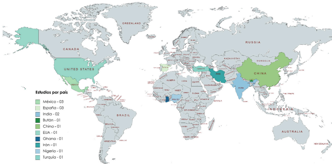
Figura 3 Distribución de artículos por país

En la Figura 3, se reportan la población y el lugar en donde se están realizando las investigaciones. Se observa una diversidad de espacios geográficos, aportando así una pluralidad de voces y perspectivas a la discusión. Los estudios tienen presencia en: México (Salazar, 2022; Mendoza, et al., 2021; Gertler, et al., 2012); España (Jurado, et al., 2020; Ibabe, 2016; Redondo, 2014); India (Mascareño, 2019; Rajan, 2019); China (Wu, 2012); Ghana (Ansong, et al., 2015); Nigeria (Akinsolu, 2015); Turquía (Küçükler, 2018); Bután (Nidup, 2022); Irán (Rezaei-Dehaghani, 2018), y Estados Unidos (Montemayor, et al., 2015).